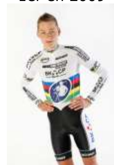
Mqathieu VAN DER POEL 1 er en 2012